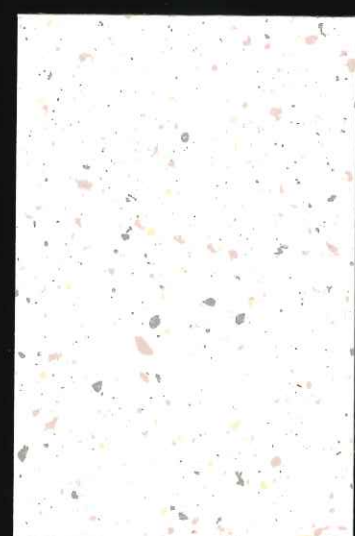
▲ CL-91 吹付け スパッタ

※カラーサンプルは、下地により実際の施工上がりとは、多少感じが違う場合がございます。