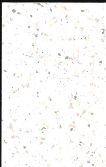
▲ CL-91 ローラー ベーシック

公共施設、オフィスビル、病院、学校、保育園、介護老人ホーム、戸建て住宅、マンション (集合住宅) など