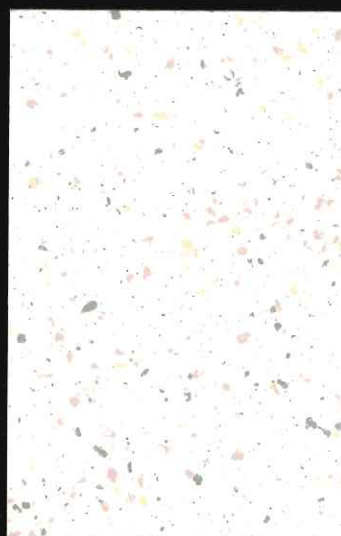
▲ CL-91 吹付け ベーシック