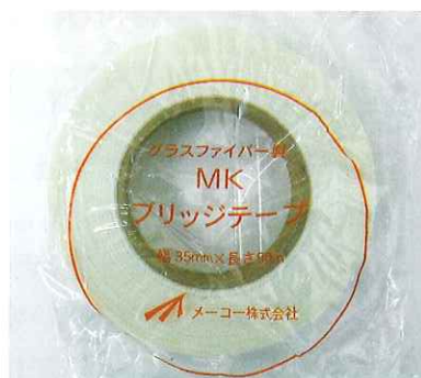
MKブリッジテープ 35mm×90m 50mm×90m