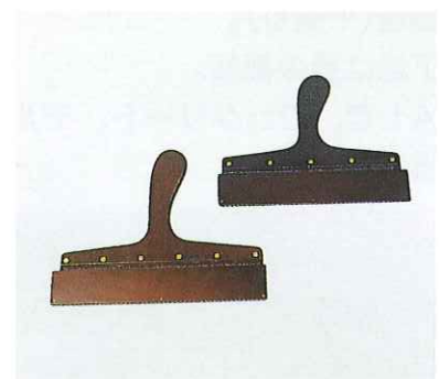
メーカー金ベラ 特45号(刃先寸法 230mm) 特50号(刃先寸法 255mm)