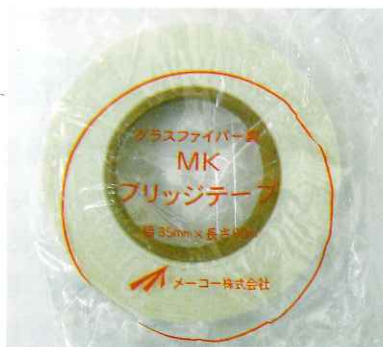
MKブリッジテープ 35mm×90m 50mm×90m