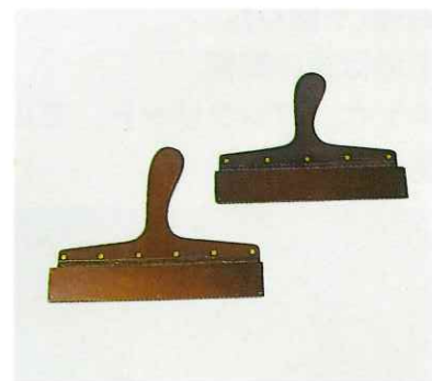
メーカー金ベラ 特45号(刃先寸法 230mm) 特50号(刃先寸法 255mm)